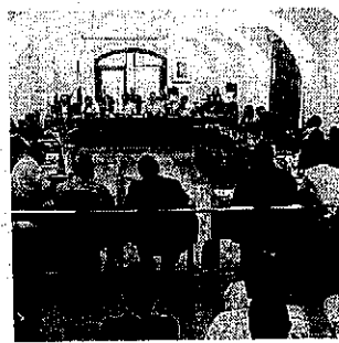
Il consiglio comunale

che la cartiere comunque avrebbe effettuato: e qualcuno dei consiglieri s'è sentito preso per i fondelli, data la mezza verità che gli era stata fornita. Replica: non è possibile votare qualcosa e poi rimangiarsi la scelta sotto una