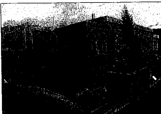
PARTE DALLA CARTIERA. Lo stabilimento della Cartiere del Garda da dove si diramano le tubazioni

Le utenze pubbliche e private di Riva del Garda e in parte del Comune di Arco.